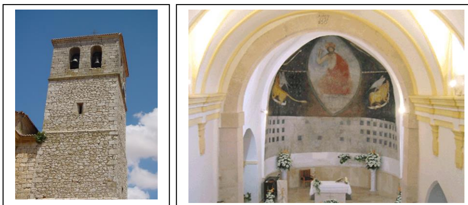
A la izquierda, la torre de la iglesia de Belmonte de Tajo, del siglo XVI. A la derecha, pinturas en la bóveda del presbiterio de la iglesia de Valdelaguna, del s. XV, aparecidas durante las obras y restauradas. La cabecera es románica del siglo s. XII

Todos estos edificios religiosos tienen una documentada historia que contar y que enseñar y en todos ellos encontramos las trazas de los mejores arquitectos de cada época, Enrique Egas, Cristóbal Adonça, Juan de Herrera, Fray Lorenzo de San Nicolás, en Colmenar de Oreja; o Alonso de Covarrubias y Nicolás de Vergara el Mozo en Chinchón.