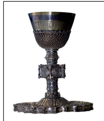
Cáliz del Cardenal Cisneros, procedente del monasterio de la Encarnación de Colmenar de Oreja, que formará parte de la exposición “Arte sacro: la presencia de Dios en el mundo”, en el Museo Ulpiano Checa, de Colmenar de Oreja.