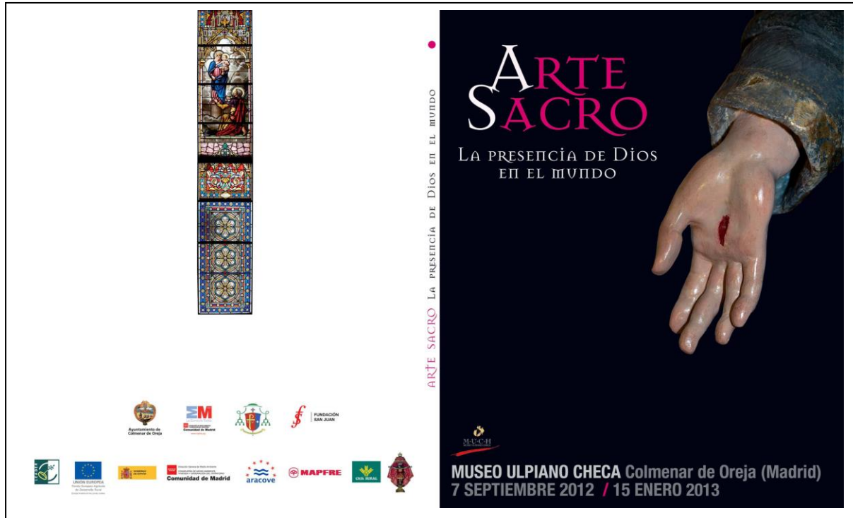
Portada y contraportada del catálogo de arte editado para la exposición "Arte sacro"

ASOCIACIÓN DE AMIGOS DEL MUSEO ULPIANO CHECA Y DE LA HISTORIA DE COLMENAR DE OREJA